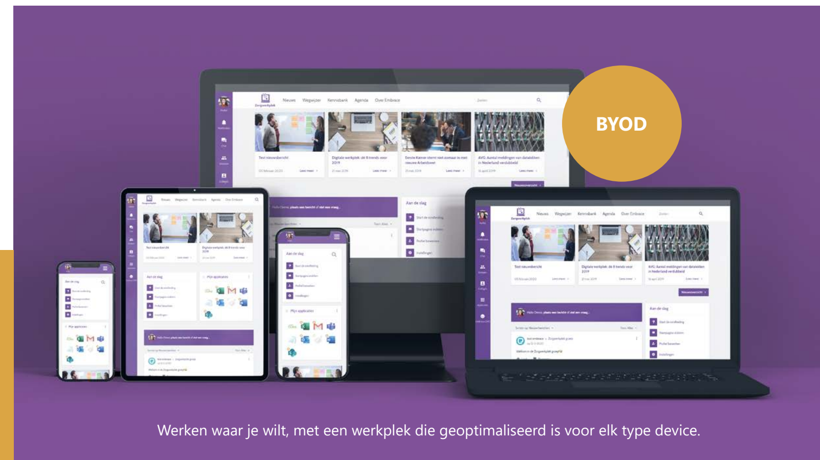
Werken waar je wilt, met een werkplek die geoptimaliseerd is voor elk type device.

eCumulus laat u zien hoe het anders kan. Het is ons antwoord op uw vraag naar meer flexibiliteit, mobiliteit en productiviteit tegen lagere kosten. eCumulus is de meest complete werkplek oplossing, inclusief geïntegreerde applicaties, hosting, beheer, beveiliging en support. Schaalbaar, applicatie-onafhankelijk en toekomstvast.