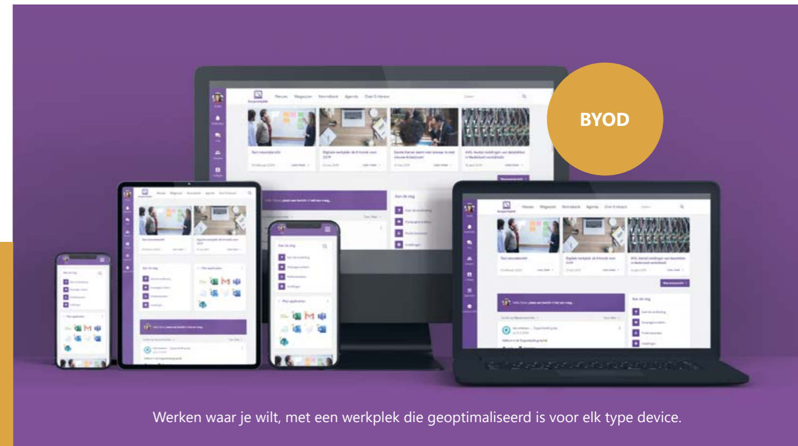
Werken waar je wilt, met een werkplek die geoptimaliseerd is voor elk type device.

eCumulus laat u zien hoe het anders kan. Het is ons antwoord op uw vraag naar meer flexibiliteit, mobiliteit en productiviteit tegen lagere kosten. eCumulus is de meest complete werkplek oplossing, inclusief geïntegreerde applicaties, hosting, beheer, beveiliging en support. Schaalbaar, applicatie-onafhankelijk en toekomstvast.